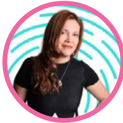
Arriba Las Pymes -Viernes 18.30 hs Chile @rosariosilvabravo